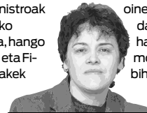
Bira Itxaro Borda

Askorentzat ihauterietako bakanak dira egunotan. Elurretara joango dira ala etxean bertan geratuko, baratzak ere bere ukitu kuttunak merezi dituen sasoi paregabea delako. Hariari tiraka, ikusi duzue nola pitotu —Amikuzen- edo ertzotü —Zuberoan- den Frantziako lehendakaria ministroak noranahi abiatzen zaizkiolako atsedean bila: MAM Tuniziara, hango iraultza bete-betean zelarik eta Filon zurbila Egiptora, Mubaraketik handizki gonbidaturik. Errana zuten Errepublikan irréprochable bat eskatzen zuela. Argi denez leze bat bada helburuaren eta